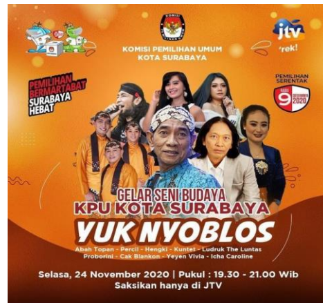
4.1.2 Gambar Yuk Nyoblos