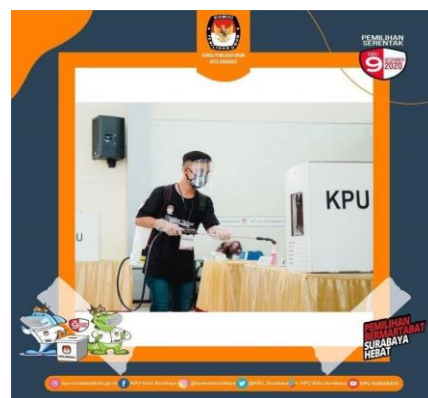
Gambar 4.1.3b Petugas membersihkan Kotak Suara

Postingan pada tanggal 21 november 2020 Kpu Kota Surabaya melakukan simulasi pemungutan dan perhitungan suara serta cara penggunaan aplikasi sirekap kepada petugas TPS (tempat pemungutan suara). Terlihat para petugas yang melakukan simulasi tetap mematuhi protokol kesehatan dengan memakai masker dan faceshield agar terhindar dari virus corona.