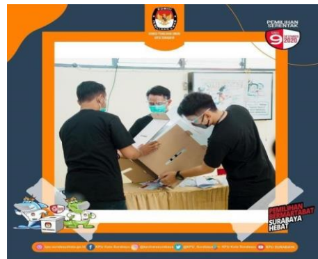
Gambar 4.1.3a Simulasi Pemungutan dan Perhitungan Suara