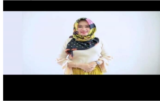
Gambar 4.1.4 Ayo ke TPS