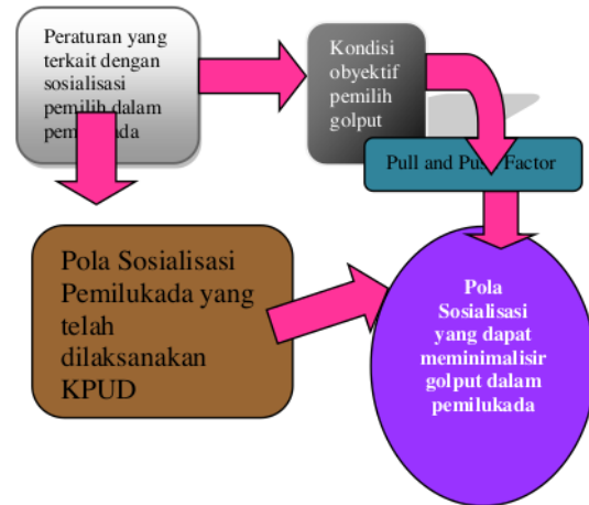
Gambar 1. Pola Yang Digunakan

Lembaga Negara yang berwenang menyelenggarakan pemilukada adalah KPUD, dalam penelitian ini adalah KPU Kabupaten/ Kota sebagaimana diatur dalam UU No.22 Tahun 2007 tentang Penyelenggara Pemilu. Lebih jelasnya, pada paragraf 3, pasal 10 ayat 3 butir e disebutkan bahwa tugas dan wewenang KPU Kabupaten/ Kota dalam menyelenggarakan pemilukada adalah mengkoordinasikan, menyelenggarakan, dan mengendalikan semua tahapan penyelenggaraan Pemilu Kepala Daerah dan Wakil Kepala Daerah Kabupaten/Kota berdasarkan peraturan perundang-undangan dengan berpedoman pada KPU dan/ atau KPU Provinsi. Dalam melaksanakan tugasnya pada penyelenggaraan pemilukada, KPU Kabupaten/ Kota diawasi oleh lembaga pengawas pemilu yaitu Panwaslu Kabupaten/ Kota, Panwaslu Kecamatan, Panwaslu lapangan, dan Panwaslu Luar Negeri ( UU No.22 Tahun 2007 ).