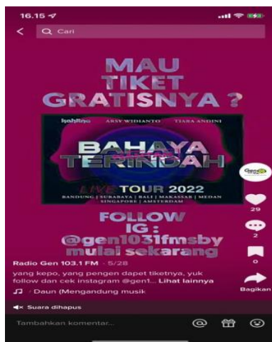
Gambar 4: Konten pengiklanan di akun @gen101fmsby

Hal tersebut mendapat antusias dari pemasang iklan. Penawaran tersebut berupa harga paket untuk memasang iklan. Dimana paket iklan sudah berisi iklan OnAir, talkshow, dan diunggah di media sosial milik Radio Gen 103.1 FM. Pengiklan lebih memilih harga paket karena sudah termasuk promosi dalam media sosial. Penerapan multimedia disini, dari pihak pengiklan mengirimkan foto store nya atau foto produk dari pengiklan. Foto tersebut