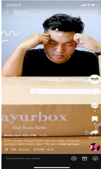
Gambar 6: Konten di akun @gen1031fmsby

melalui media sosial tiktok, di akun @gen1031fmsby.