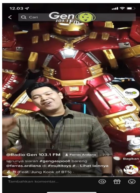
Gambar 5: Konten pengiklanan di akun @gen1031fmsby

media sosial agar dapat diakses seluruh masyarakat. Berdasarkan hasil wawancara dengan tim digital Radio Gen 103.1 FM, bahwa pemasang iklan yang didapat juga mengetahui dari pengiklan lain yang produknya diunggah di media sosial atau disiarkan melalui radio streaming. Sehingga dengan begitu, banyak pengiklan memilih paket harga agar bisa diunggah melalui media sosial tiktok Radio Gen 103.1 FM