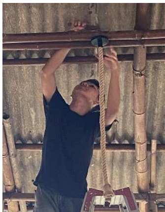
Gambar 6. Perbaikan dan Pembersihan Lokasi Budidaya Jamur