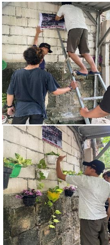
Gambar 12. Pemberian Tanaman pada Area Cagar Budaya