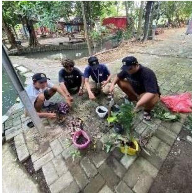
Gambar 13. Pemberian Tanaman pada Area Cagar Budaya