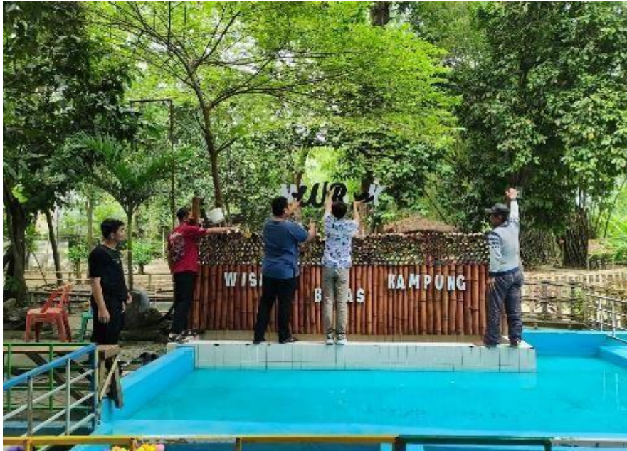
Gambar 9. Penambahan Aksesoris pada Area Kolam