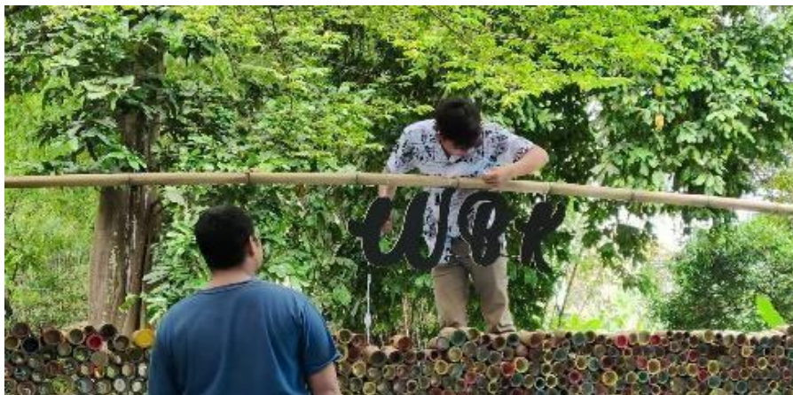
Gambar 8. Penambahan Aksesoris pada Area Kolam

Pembersihan dan perbaikan arean Wisata Batas Kampung dan penanaman tumbuhan dengan tujuan agar memperindah suasana lokasi Wisata Batas Kampung agar lebih menarik.