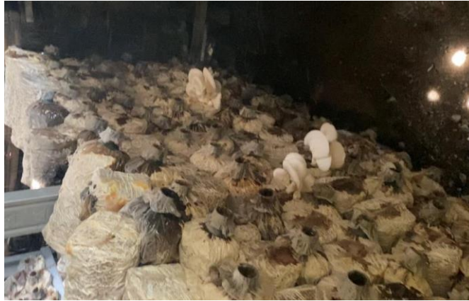
Gambar 4. Budidaya Jamur Tiram

Selama KKN kami berjalan kami juga berkonsentrasi pada pengembangan budidaya jamur yang hampir tidak dilanjutkan karena cuaca yang tidak menentu. Hal ini dapat menjadi factor penghambat utama pada perkembangan budidaya jamur. Dalam hal ini kami coba melakukan edukasi dan menambah wawasan masyarakat atau pengelola budidaya jamur pada lokasi tersebut.