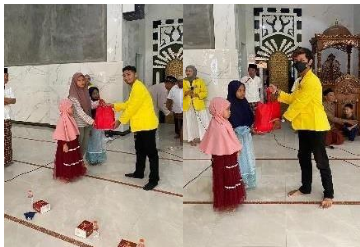
Gambar 3. Program Bakti Sosial dengan Anak Yatim Piatu dan Dhuafa