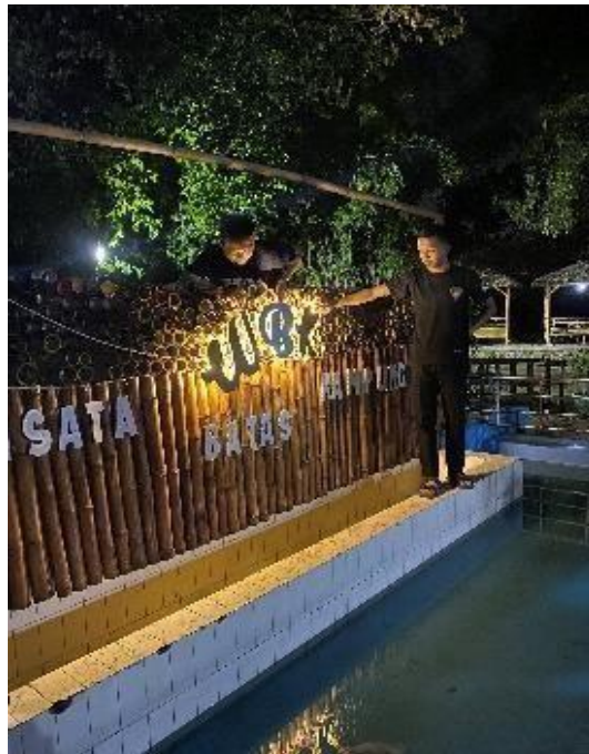
Gambar 11. Bersih-bersih Area Cagar Budaya