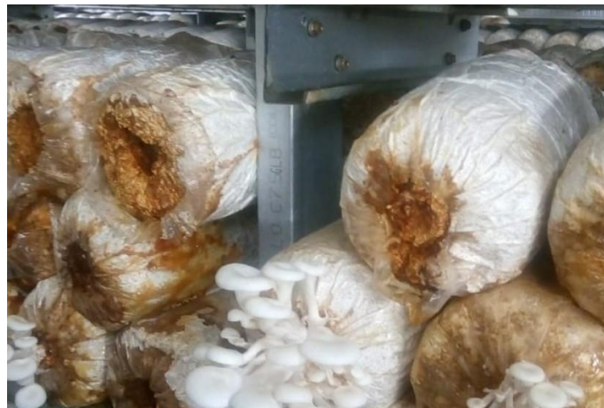
Gambar 5. Budidaya Jamur Tiram Banyak yang Gagal