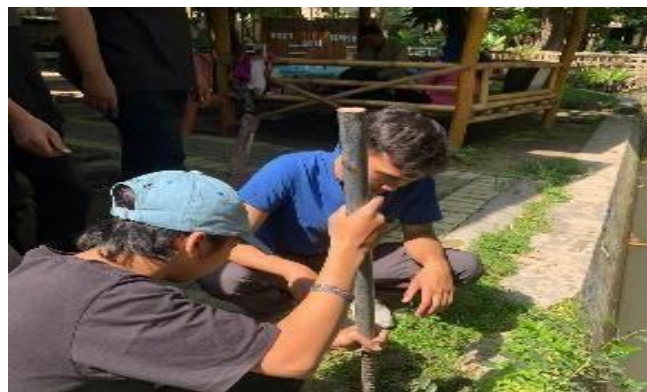
Gambar 7. Perbaikan dan Pembersihan Lokasi Budidaya Jamur

Pembersihan dan perbaikan arean Wisata Batas Kampung dan penanaman tumbuhan dengan tujuan agar memperindah suasana lokasi Wisata Batas Kampung agar lebih menarik.