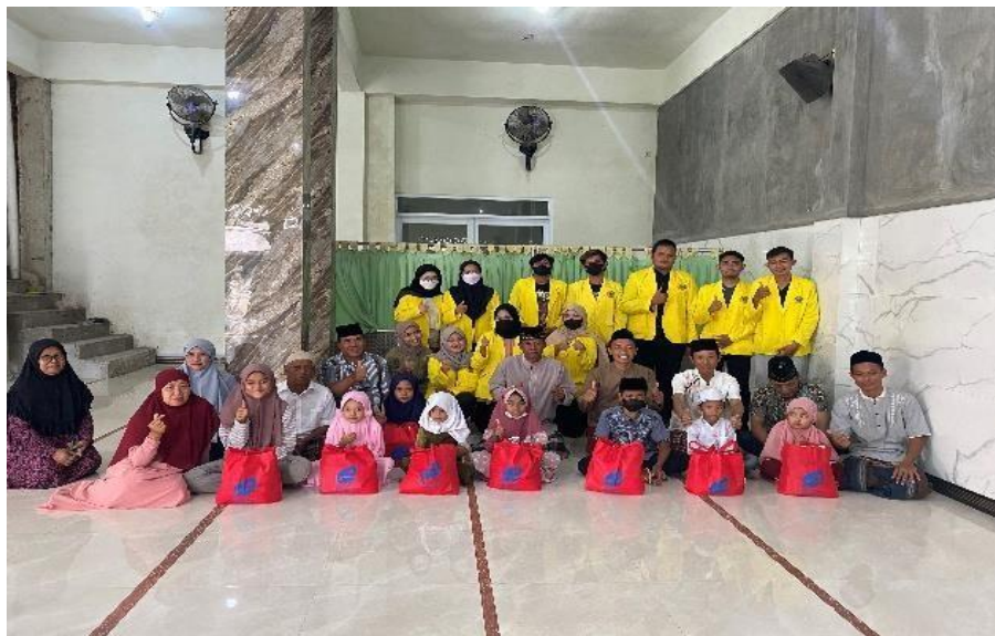
Gambar 2. Program Bakti Sosial dengan Anak Yatim Piatu dan Dhuafa

Bakti sosial ini kami lakukan dengan dukungan perangkat desa setempat dan suatu perusahaan yang bergerak pada bidang konsultan lingkungan. Hal ini kami lakukan dengan harapan dapat meningkatkan kembali kesadaran kita sebagai makhluk hidup agar saling tolong menolong mengas ihi dan menyayangi saudara sesama yang masih membutuhkan bantuan kita.