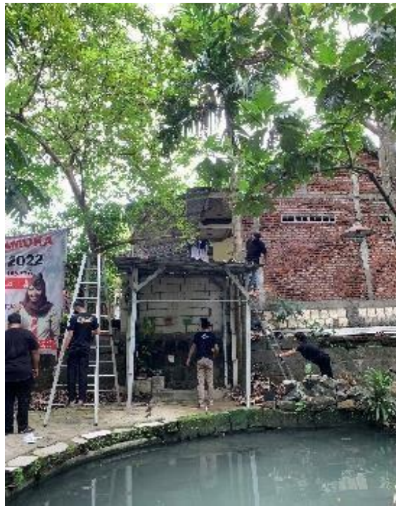
Gambar 10. Bersih-bersih Area Cagar Budaya