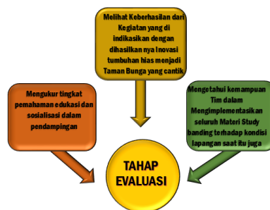
Gambar 3: Skema Proses Tahap Evaluasi