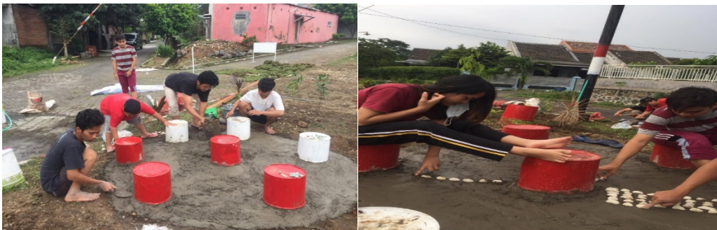
Gambar 8 & 9: Proses Pengecoran Untuk Tempat Duduk Dan Menata Batu Alam Untuk Refleksi Kaki Dan Sebagai Hiasan

Dari gambar 6 dan 7 merupakan proses penanaman tanaman hias untuk ditanam di lahan tersebut agar lebih asri. Terdapat lebih dari 50 tanaman sudah ditanam dan ada beberapa tanaman yang layu dan mati karena tidak bisa hidup di tanah yang sudah terkontaminasi dengan sampah gagal bangunan. Agar semua tanaman tumbuh subur, lalu tanah tersebut ditimbun dengan tanah yang bagus lalu ditanami rumput gajah mini agar terlihat lebih hijau dan asri.