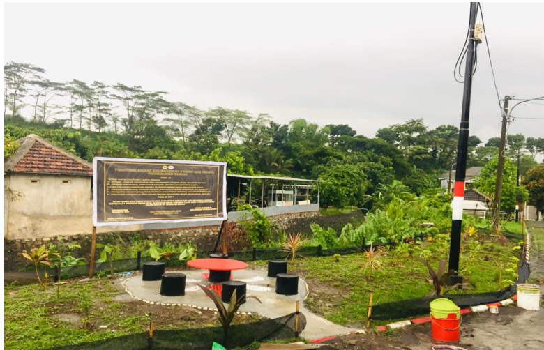
Gambar 12: Hasil Akhir Dari Pembuatan Taman Untuk Kelestarian Lingkungan Di Pinggir Kali

terbiasa membuang sampah sembarangan agar patuh dan tidak akan mengulangi membuang sampah sembarangan lagi karena sudah mengetahui ada hukuman terkait membuang sampah sembarangan.