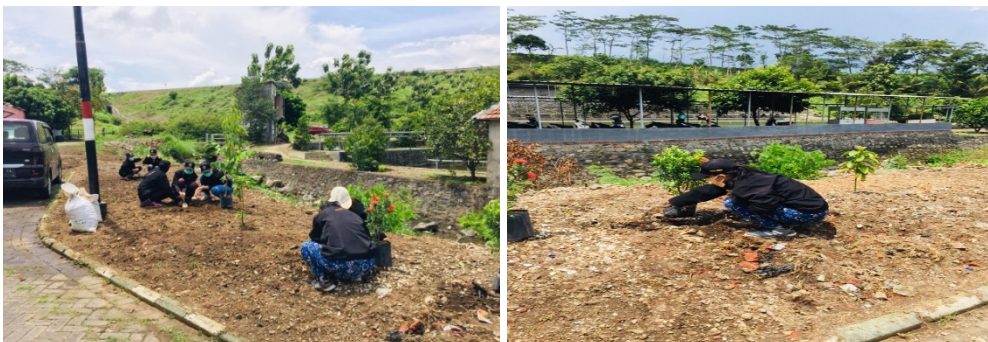
Gambar 6 & 7 : Proses Penanaman Tanaman Hias Untuk Dijadikan Taman

Dari gambar 5 & 6 merupakan proses membersihkan dan meratakan tanah dari gragal bekas bangunan akibat dari masyarakat sekitar yang gemar membuang sampah di lahan kosong dekat dengan sungai. Karena sudah terlalu banyak sampah gragal bangunan yang menyatu dengan tanah, tentunya cukup sulit untuk mengembalikan tanah yang subur seperti semula.