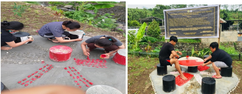
Gambar 10 & 11: Proses Pengecatan Batu Alam, Tempat Duduk, Meja Sekaligus Pemasangan Banner Aturan Perda Tentang Larangan Membuang Sampah Sembarangan.

Dari gambar 8 dan 9 merupakan proses pengecoran untuk tempat duduk di tengah taman dan menata batu alam untuk refleksi kaki supaya terlihat semakin cantik dan bermanfaat untuk refleksi kaki dan tentunya agar masyarakat sekitar bisa menikmati dan bersantai menghilangkan penat di taman dengan nyaman.