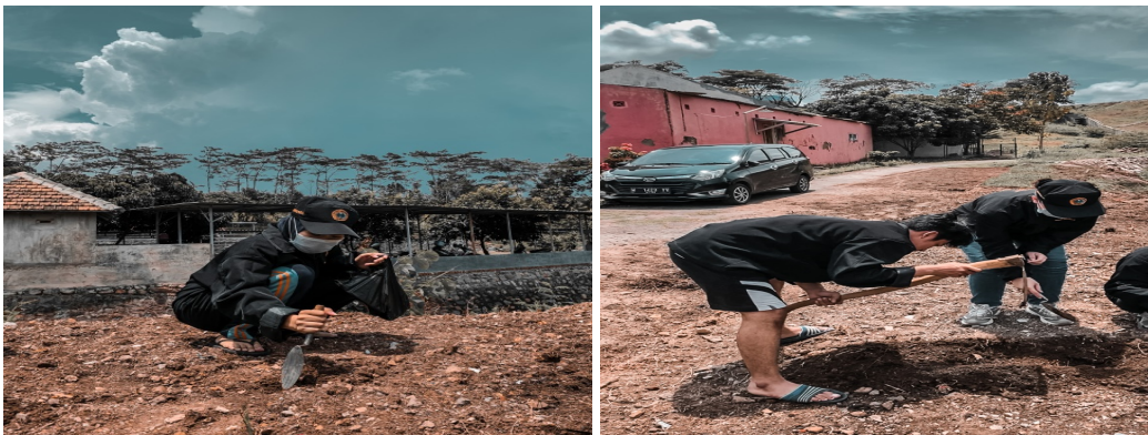
Gambar 4 & 5: Proses Membersihkan dan Meratakan Tanah Gragal Bekas Banguna

tanaman hias perlu melakukan di gali agar tanah bisa menjadi subur perlu dilakukan pemupukkan sebelum memasukkan bibit pohon atau tanaman hias setelah itu barulah di ratakan dengan tanah. Langkah kedua setelah selesai menanam tanaman saatnya melakukan pengecoran yaitu campurkan pasir dan semen dan tambahkan sedikit air barulah mulai melakukan pengecoran, serta menambahkan batu alam sebagai refleksi, kemudian memasang tong besi bekas untuk tempat duduk dan meja kayu. Setelah menunggu 2 hari pengeringan kemudian mulai pengecatan dari tempat duduk, meja, batu relfeksi, dan trotoar sampai pendopo tempat baca. Langkah terakhir adalah melakukan pemasangan banner berisi peraturan daerah dan juga peraturan yang memperingatkan tidak membuang sampah sembarangan, kemudian memasang paranet sebagai pembatas antara tanaman dan tempat duduk. Kegiatan diuraikan gambar-gambar dibawah sebagai berikut: