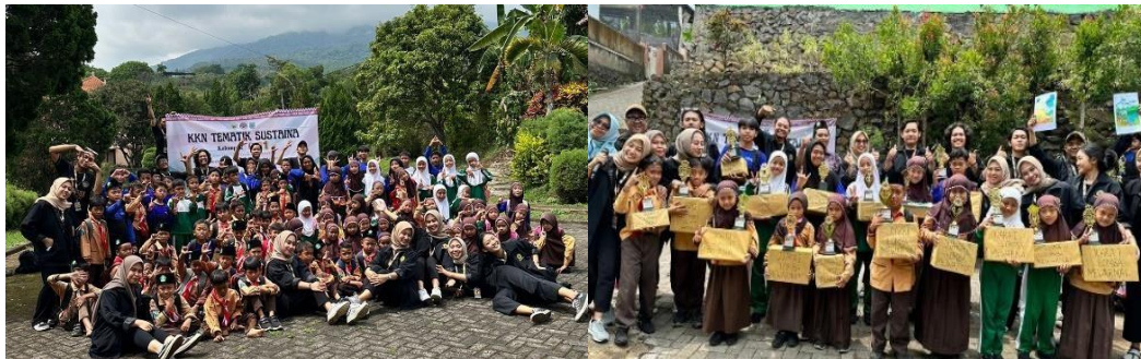
Gambar 3. Dokumentasi Kegiatan Outdoor learning

Outdoor learning adalah merupakan aktivitas pembelajaran yang didesain sedemikian rupa agar santri mempelajari langsung materi pelajaran pada obyek yang sebenarnya, sehingga pembelajaran semakin nyata dan bermakna. Sasaran kegiatan tersebut Siswa Sekolah Dasar dan Anggota Karang Taruna yang bertujuan untuk memberikan pengalaman belajar yang lebih langsung dan terlibat dengan lingkungan alam serta mempererat hubungan sosial antara individu atau kelompok.