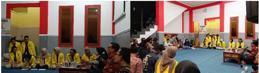
Gambar 5. Dokumentasi Kegiatan Bahaya Minuman Keras dan Narkba

Proses pelaksanaan program sosialisasi bahaya narkoba dan minuman keras serta dampak hukum bagi penggunaannya di Paras berjalan dengan baik. Masyarakat khususnya para pemuda mampu memahami bahaya penggunaan narkoba dan minuman keras baik bagi kesehatan maupun bagi lingkungan. Selain itu setelah diadakannya sosialisasi para pemuda dusun menjadi paham bahwa menggunakan narkoba dan minum minuman keras juga melanggar hukum dan dapat dipidanakan. Dengan bertambahnya pengetahuan warga berkaitan dengan bahaya narkoba dan minuman keras serta dampak hukumnya diharapkan tidak terdapat warga desa Paras yang mengkonsumsi narkoba ataupun minuman keras. Namun perlu adanya kerjasama dari seluruh lapisan masyarakat dalam melakukan pemantauan secara rutin dan pembuatan aturan yang tegas untuk mencegah beredarnya narkoba dan minuman keras di Desa Paras.