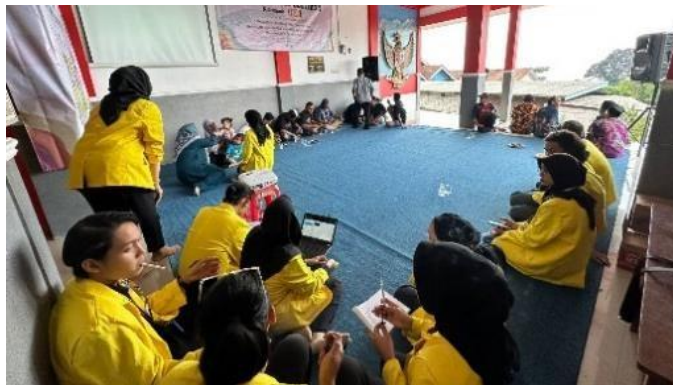
Gambar 6. Dokumentasi Kegiatan Penyuluhan Hukum

Dalam kegiatan Pengabdian Masyarakat kali ini, adapunsasaran yang telah kami tentukan untuk diberikan sosialisasi adalah semua kalangan masyarakat di Desa Paras. Kegiatan Sosialisasi pada hari Senin, 04 Desember 2023 di tempat Balai RW Lingkungan Paras. Materi pelaksanaan kegiatan pengabdian masyarakat sosialisasi payung hukum yaitu Perlindungan Hukum terhadap perlindungan hak dan kebebasan, pencegahan kriminalitas, dan penyelesaian sengketa.