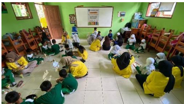
Gambar 2. Melaksanakan Kegiatan P5 (Proyek Penguatan Profil Pelajar Pancasila)

Implementasi P5 (Proyek Penguatan Profil Pelajar Pancasila) dalam kurikulum merdeka pada pembelajaran Siswa Sekolah Dasar yang bertujuan untuk membentuk peserta didik sebagai individu yang memiliki kompetensi global dan perilaku yang mencerminkan nilai-nilai Pancasila dalam kehidupan sehari-hari. Penguatan P5 yang bertempat di MI Mifathul Ulum Lingkungan Paras. Selain itu program ini dilaksanakan di Balai RW Lingkungan Paras untuk membantu siswa untuk memahami materi pelajaran dengan lebih baik, mengatasi kesulitan belajar, dan memperkuat pemahaman konsep-konsep kunci.