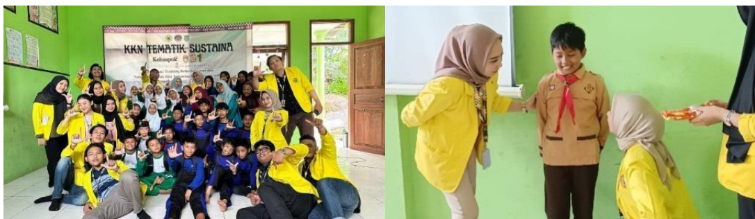
Gambar 4. Dokumentasi Kegiatan Sosialisasi Bullying

Pelaksanaan Pengabdian Kepada Masyarakat yang berisi kegiatan Sosialisasi Bullying di MI Miftahul Ulum Lingkungan Paras Pada hari Jumat, 01 Desember 2023. Sosialisasi pendidikan anti bullying merupakan bentuk dari pengabdian masyarakat oleh Univeristas Bhayangkara guna mengurangi kenakalan remaja terutama kasus pembullying/perundungan di lingkungan pendidikan. Pada sosialisasi ini, materi sosialisasi. yang dimana dalam penyampiannya menjelaskan terkait penjelasan bullying, pencegahan bullying, dampak bullying dan langkah-langkah perlindungan hukum bagi korban bully. Sosialisasi ini dilaksanakan sebagai langkah awal pencegahan tindakan perundungan/pembullying di lingkungan pendidikan tingkat SD khususnya.