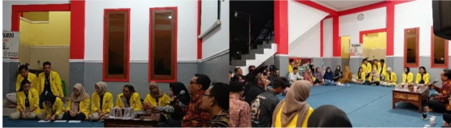
Gambar 5. Dokumentasi Kegiatan Bahaya Minuman Keras dan Narkba

Proses pelaksanaan program sosialisasi bahaya narkoba dan minuman keras serta dampak hukum bagi penggunaannya di Paras berjalan dengan baik. Masyarakat khususnya para pemuda mampu memahami bahaya penggunaan narkoba dan minuman keras baik bagi kesehatan maupun bagi lingkungan. Selain itu setelah diadakannya sosialisasi para pemuda dusun menjadi paham bahwa menggunakan narkoba dan minum minuman keras juga melanggar hukum dan dapat dipidanakan. Dengan bertambahnya pengetahuan warga berkaitan dengan bahaya narkoba dan minuman keras serta dampak hukumnya diharapkan tidak terdapat warga desa Paras yang mengkonsumsi narkoba ataupun minuman keras. Namun perlu adanya kerjasama dari seluruh lapisan masyarakat dalam melakukan pemantauan secara rutin dan pembuatan aturan yang tegas untuk mencegah beredarnya narkoba dan minuman keras di Desa Paras.