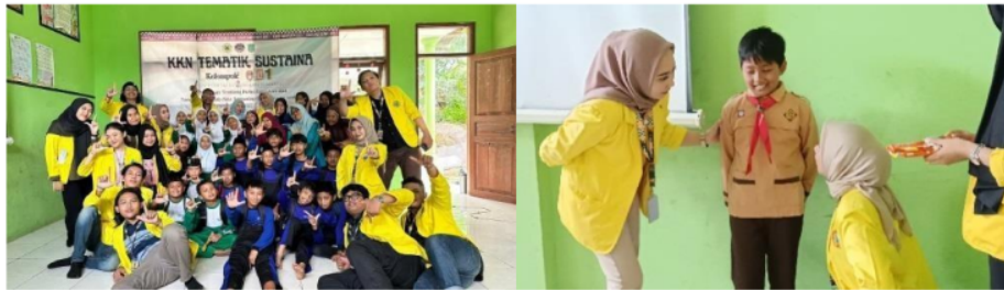
Gambar 4. Dokumentasi Kegiatan Sosialisasi Bullying

Pelaksanaan Pengabdian Kepada Masyarakat yang berisi kegiatan Sosialisasi Bullying di MI Miftahul Ulum Lingkungan Paras Pada hari Jumat, 01 Desember 2023. Sosialisasi pendidikan anti bullying merupakan bentuk dari pengabdian masyarakat oleh Univeristas Bhayangkara guna mengurangi kenakalan remaja terutama kasus pembullying/perundungan di lingkungan pendidikan. Pada sosialisasi ini, materi sosialisasi yang dimana dalam penyampaianya menjelaskan terkait penjelasan bullying, pencegahan bullying, dampak bullying dan langkah-langkah perlindungan hukum bagi korban bully. Sosialisasi ini dilaksanakan sebagai langkah awal pencegahan tindakan perundungan/pembullying di lingkungan pendidikan tingkat SD khususnya.