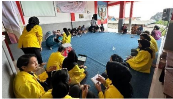
Gambar 6. Dokumentasi Kegiatan Penyuluhan Hukum

Dalam kegiatan Pengabdian Masyarakat kali ini, adapunsasaran yang telah kami tentukan untuk diberikan sosialisasi adalah semua kalangan masyarakat di Desa Paras. Kegiatan Sosialisasi pada hari Senin, 04 Desember 2023 di tempat Balai RW Lingkungan Paras. Materi pelaksanaan kegiatan pengabdian masyarakat sosialisasi payung hukum yaitu Perlindungan Hukum terhadap perlindungan hak dan kebebasan, pencegahan kriminalitas, dan penyelesaian sengketa.