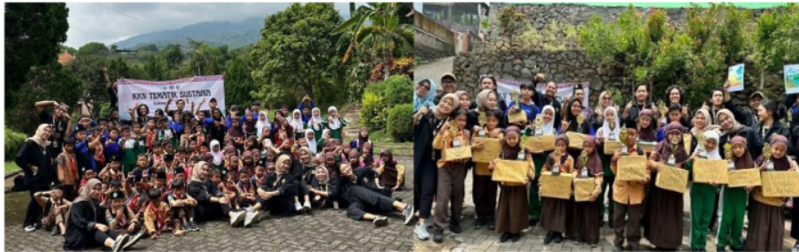
Gambar 3. Dokumentasi Kegiatan Outdoor learning

Outdoor learning adalah merupakan aktivitas pembelajaran yang didesain sedemikian rupa agar santri mempelajari langsung materi pelajaran pada obyek yang sebenarnya, sehingga pembelajaran semakin nyata dan bermakna. Saat kegiatan tersebut Siswa Sekolah Dasar dan Anggota Karang Taruna yang bertujuan untuk memberikan pengalaman belajar yang lebih langsung dan terlibat dengan lingkungan alam serta mempererat hubungan sosial antara individu atau kelompok.