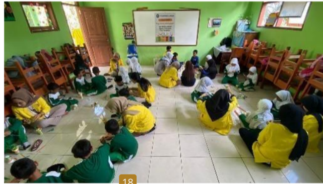
Gambar 2. Melaksanakan Kegiatan P5 (Proyek Penguatan Profil Pelajar Pancasila)

Implementasi P5 (Proyek Penguatan Profil Pelajar Pancasila) dalam kurikulum merdeka pada pembelajaran Siswa Sekolah Dasar yang bertujuan untuk membentuk peserta didik sebagai individu yang memiliki kompetensi global dan perilaku yang mencerminkan nilai-nilai Pancasila dalam kehidupan sehari-hari. Penguatan P5 yang bertempat di MI Mifathul Ulum Lingkungan Paras. Selain itu program ini dilaksanakan di Balai RW Lingkungan Paras untuk membantu siswa untuk memahami materi pelajaran dengan lebih baik, mengatasi kesulitan belajar, dan memperkuat pemahaman konsep-konsep kunci.