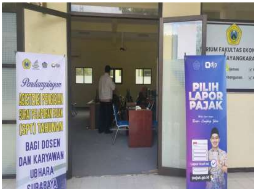
Gambar 1. Lokasi Kegiatan PKM di Laboratorium FEB UBHARA Surabaya