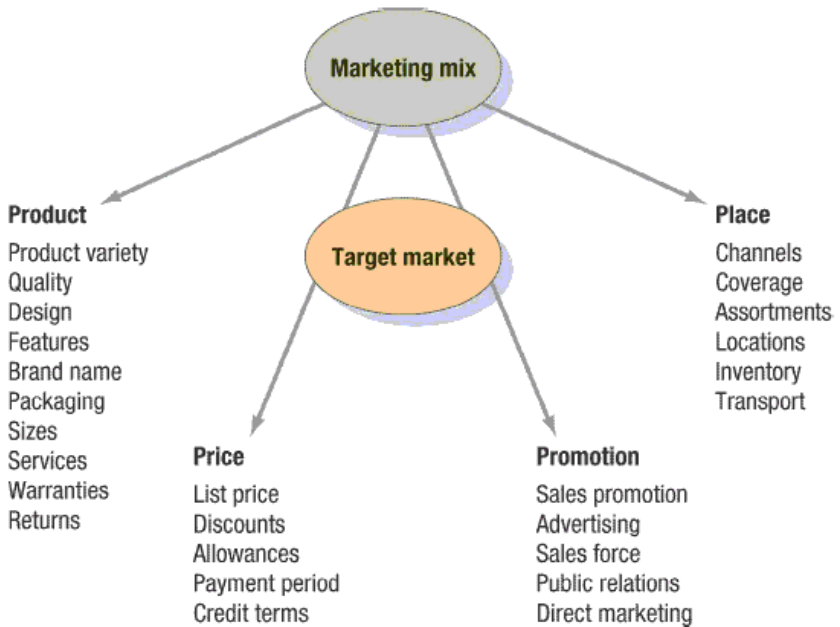
Gambar 2 Marketing Mix

empat hal yang biasa disebut dengan 4 P. Empat P yang di maksudkan adalah: produk ( Product ), harga ( Price ), tempat ( Place ) dan promosi ( Promotion ).