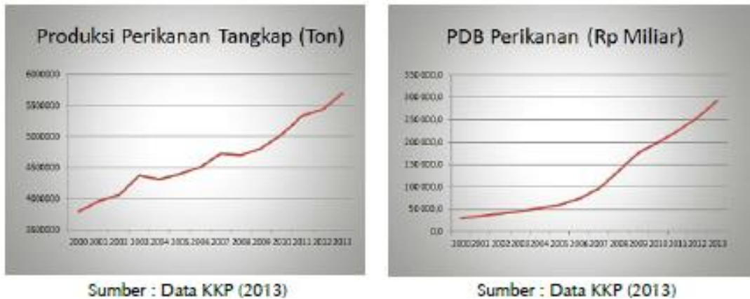
Gambar 1 Produksi perikanan Tangkap dan PDB Perikanan 2000-2013

1:250.000. Dengan data tersebut, maka wajar saja bila potensi sektor perikanan Indonesia sangat besar.