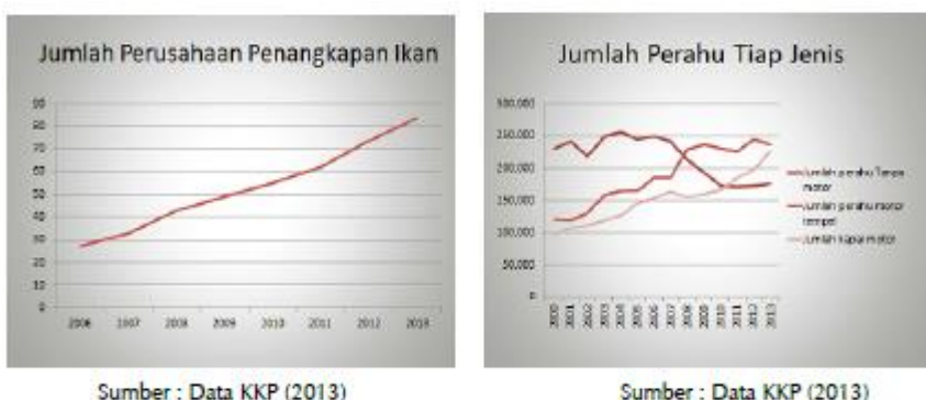
Gambar 2 Jumlah Perusahaan Penangkap Ikan dan Jumlah Perahu Tiap Jenis 2006-2013

Selain untuk konsumsi, dengan potensi melimpah, dunia kelautan dan perikanan bisa menjadi ruang usaha yang sangat luas dan mendatangkan pendapatan bagi masyarakat di samping sektor-sektor lainnya. Terlebih lagi bila teknologi yang digunakan dari hulu sampai hilir sudah dimodernisasi.