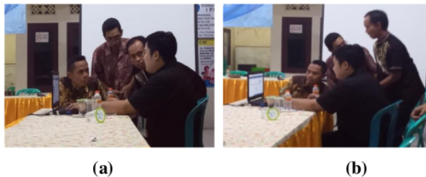
Foto : Pembuatan Akun Website Tanjungan