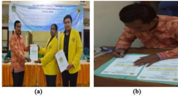
Foto : Launching Website Tanjungan