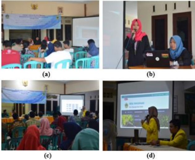
Foto Sosialisasi Pembelajaran Website