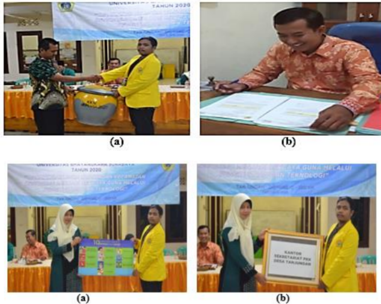
Foto :Penyerahan tempat sampah dan Pemberian Banner