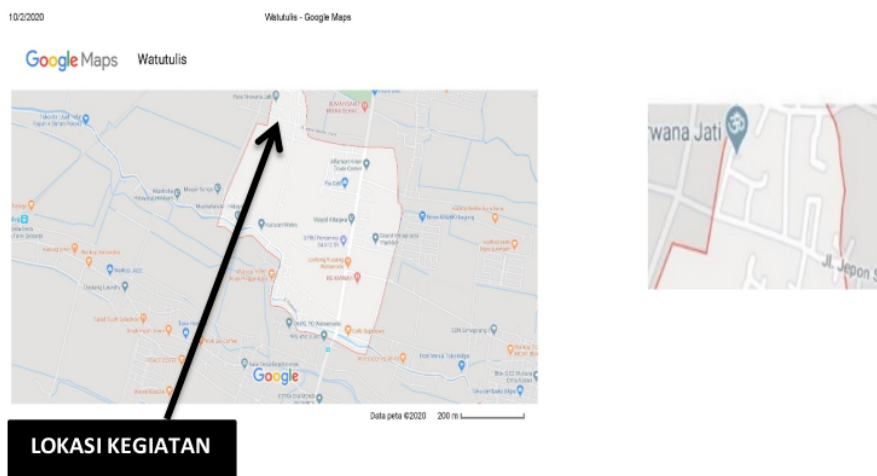
Gambar 1. Peta Desa Watutulis dan Dusun Sekelor

Kegiatan KKN 2020 dilaksanakan di Dusun Sekelor Utara, Desa Watutulis, Kecamatan Prambon Kabupaten Sidoarjo. Desa Watutulis adalah salah satu desa yang berada di dataran rendah secara geografis. Desa Watutulis termasuk desa agraris dimana sebagian besar penduduknya bermata pencaharian sebagai petani tetapi ada juga yang bekerja sebagai sopir, pedagang dan wirausaha. Masyarakat di Desa Watutulis beraktivitas mulai pagi hari hingga petang sehingga masyarakat jarang peduli terhadap lingkungan hal tersebut dapat dilihat dari banyaknya tumpukan sampah disebagian sudut di desa tersebut.