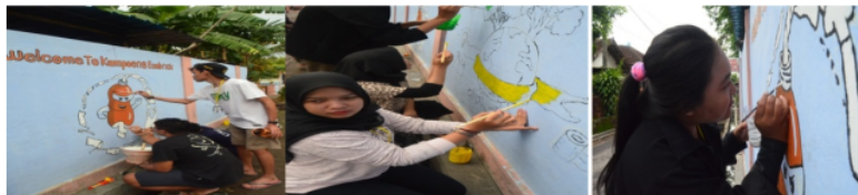
Gambar 5. Sketsa Mural Jalan Utama Di RT 003 RW 006 Dusun Sekelor Utara