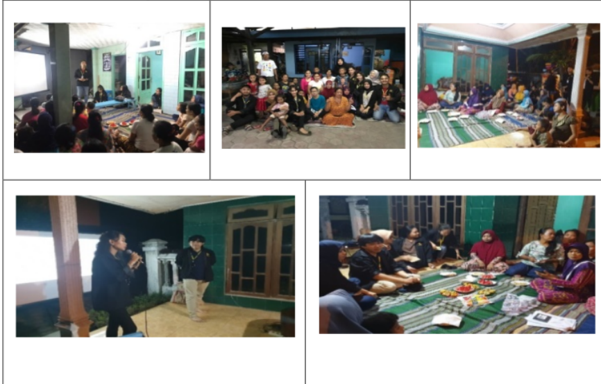
Gambar 3. Penyuluhan Sampah Plastik dan Bank Sampah

Penyuluhan tersebut disampaikan materi untuk mengubah pola pikir warga Dusun Sekeloa Utara terutama ibu-ibu. Peserta yang datang dalam acara penyuluhan ini sangat antusias, mereka menyimak dengan seksama dan ada tanggapan yang cukup bervariasi. Dalam penyuluhan pengelolaan sampah plastik kami menampilkan video bagaimana sampah plastik akan terurai beribu-ribu tahun, kemudian kami memperlihatkan video kepada ibu-ibu bagaimana sampah botol plastik dapat dibuat kerajinan tangan.