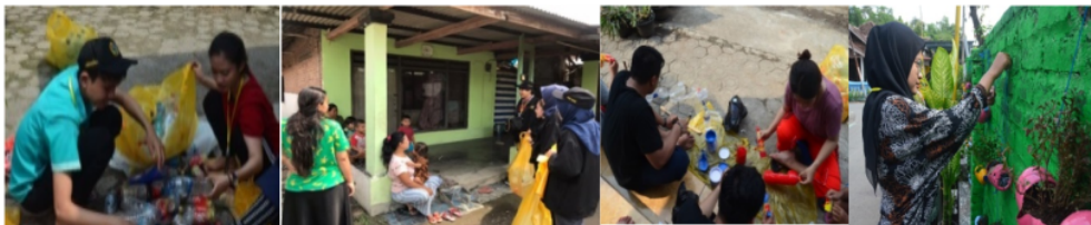
Gambar 4. Pengambilan Botol Plastik, Pemilahan Botol Plastik, dan Pengecatan Botol Plastik